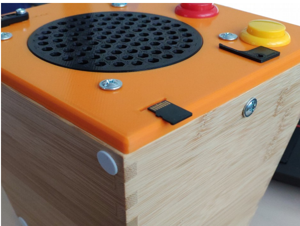
Abbildung 3: Orientierung der SD-Karte im Slot