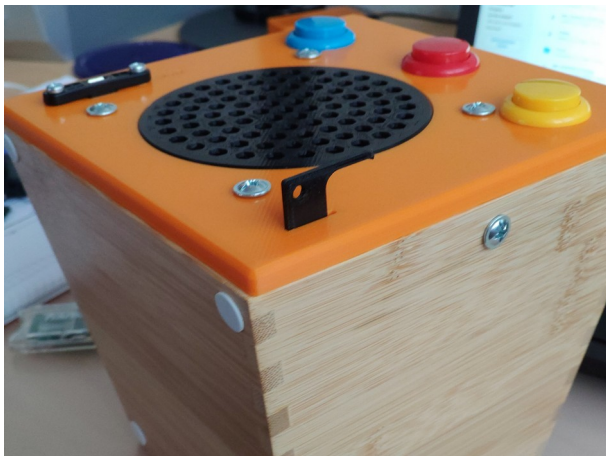
Abbildung 1: Mit breiter Seite des Werkzeugs SD-Karte entriegeln