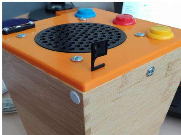
Abbildung 2: Mit Haken SD-Karte herausziehen